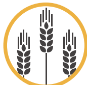
Derivados de la Cebada