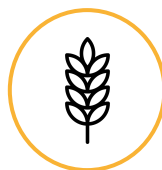
Derivados de la cebada